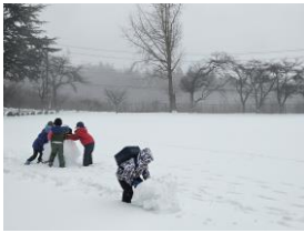
3. 5 雪の日