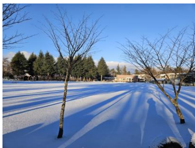
2. 4 雪の日