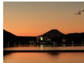
1.2 日の出 下諏訪から